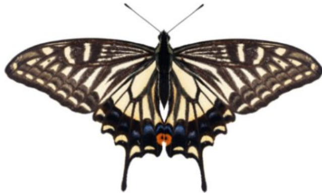
属 Papilio 種小名 xuthus 英名 和名 ナミアゲハ 分布 東アジア 開長 80mm 春型 食草 ミカン科のサンショウなど野生種、およびカラタチやミカン類の栽培種。