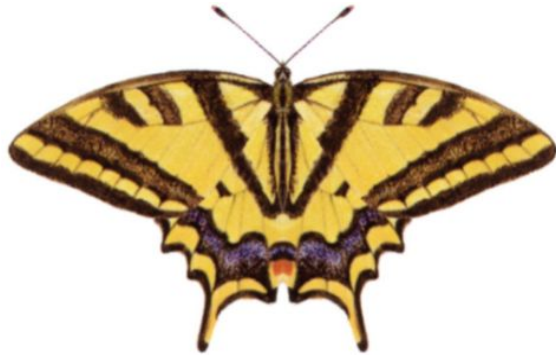
属 Papilio 種小名 alexanor 英名 Southern Swallowtail 和名 トラフキアゲハ 分布 西欧～北アフリカ 開長 80mm ♀ 食草 Trinia vulgari