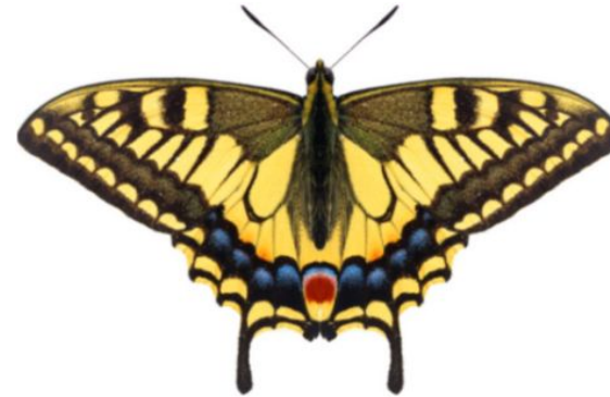
属 Papilio 種小名 machaon 英名 Swallowtail 和名 キアゲハ 分布 全北区 開長 80mm 春型 食草 セリ科セリなど、栽培種のニンジン、パセリなど。